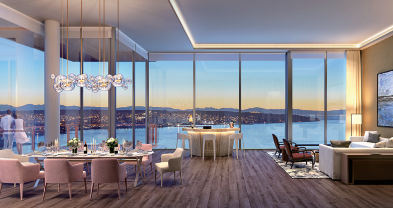
位於溫哥華之 Empire Landmark 酒店之重建住宅項目

本集團之合營公司現正發展另一座落半山寶珊道之豪華住宅項目。地基建築工程現正進行中並預期於二零一八年年中竣工。