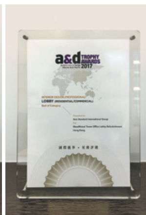
最佳辦公室大堂翻新 Architecture & Design Awards Asia Pacific 2017