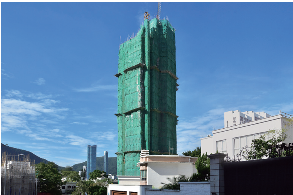
位於渣甸山白建時道之豪華住宅項目