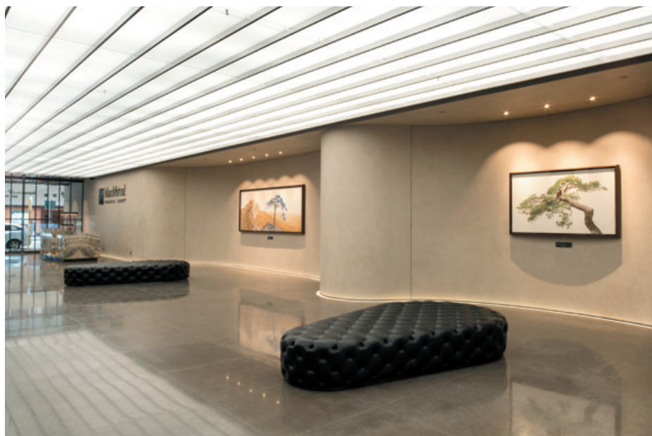
美國萬通大廈之大堂