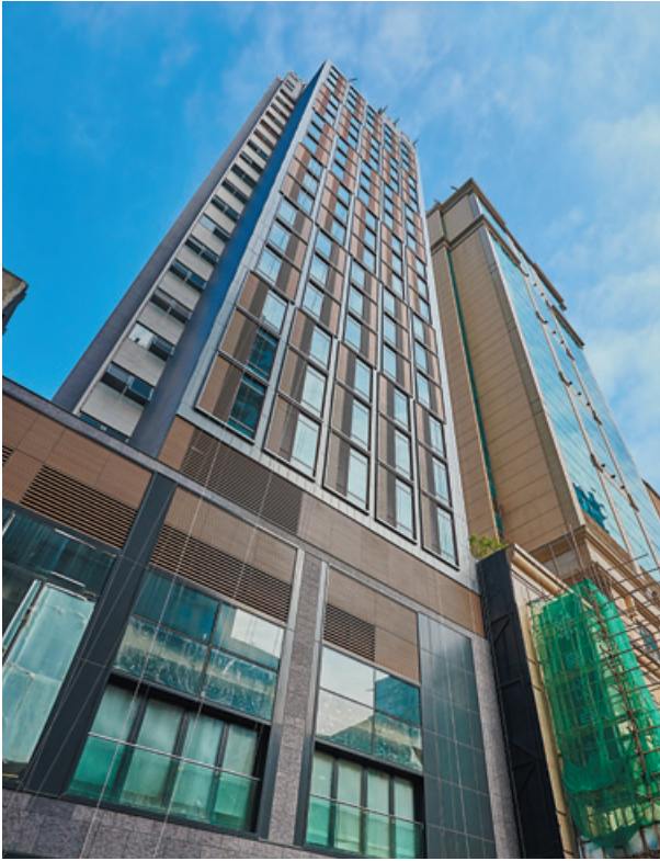
尖沙咀新酒店 (毗鄰九龍皇悅酒店)