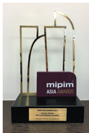
銅獎得主 最佳翻新樓宇 MIPIM ASIA AWARDS 2017